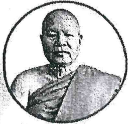
พระราชวชิราภรณ์ ประธานกรรมการการศึกษาพระปริยัติธรรม แผนกสามัญศึกษา