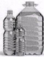
1. น้ำมันพืชทุกชนิด