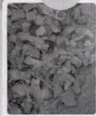
4. น้ำมันจากไขมันสัตว์