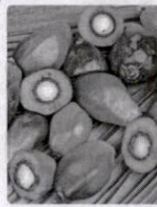
2. น้ำมันปาล์ม